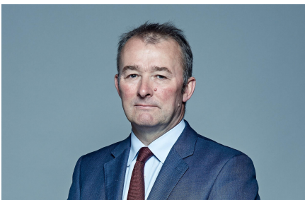
The Rt Hon Simon Hart MP Secretary of State for Wales