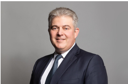
The Rt Hon Brandon Lewis CBE MP Secretary of State for Northern Ireland