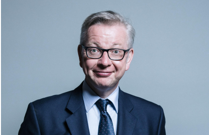
The Rt Hon Michael Gove MP Chancellor of the Duchy of Lancaster and Minister for the Cabinet Office