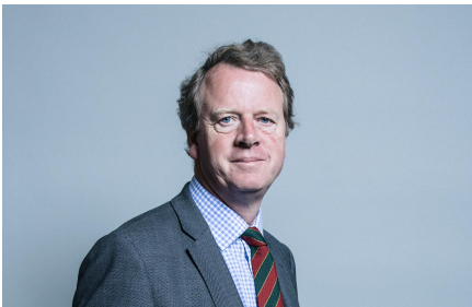
The Rt Hon Alister Jack MP Secretary of State for Scotland